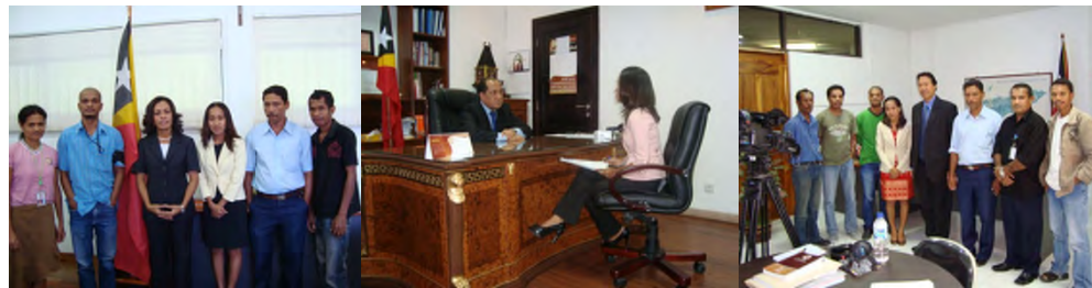
Equipa de Produção do Programa com SE MJ