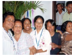
Fotos referentes a festa de Inauguração do Espaço "Happy Hour", onde decorreu a festa Convívio de Natal.